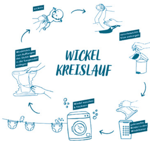
Illustration © popolini

Eltern, die einen umweltfreundlicheren Weg gehen möchten, können auch auf Mehrweg-Stoffwindeln umsteigen. Diese erzeugen deutlich weniger Abfall und leisten einen wichtigen Beitrag zur Ressourcenschonung.