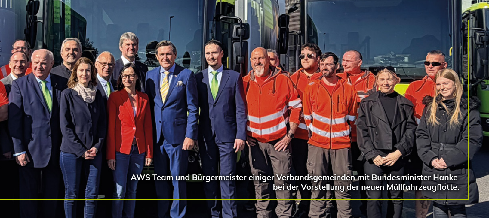
AWS Team und Bürgermeister einiger Verbandsgemeinden mit Bundesminister Hanke bei der Vorstellung der neuen Müllfahrzeugflotte.